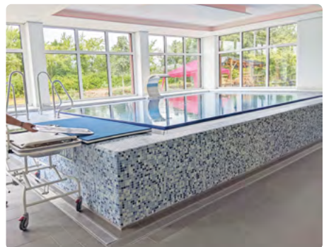
Bewegungsbad in der Schule

Wir sind dabei Regelungen zur Nutzung für unsere Bewohner am Wochenende und in den Ferien für das Bewegungsbad im Schulhaus zu finden.